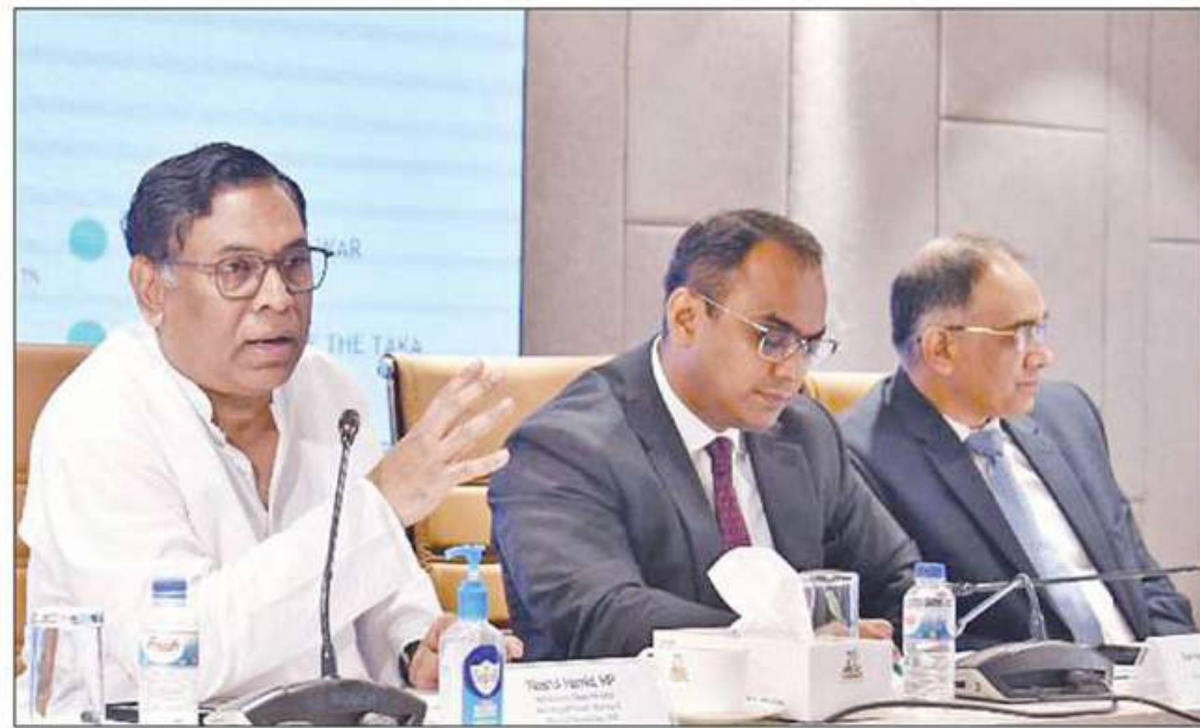
State Minister for Power, Energy and Mineral Resources Nasrul Hamid speaks at a dialogue at Dhaka Chamber of Commerce and Industry (DCCI) auditorium on Saturday.