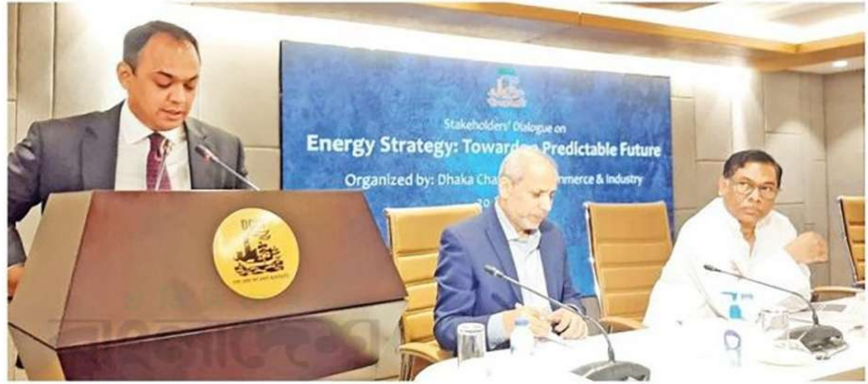
জ্বালানি নিরাপত্তাবিষয়ক সেমিনারে বক্তব্য রাখছেন ডিসিসিআইয়ের সভাপতি

দৈনিক গ্যাসের চাহিদার বিষয়ে প্রতিমন্ত্রী বলেন, 'বর্তমানে ৩ হাজার ৫০০ এমএমসিএফডি গ্যাসের চাহিদার বিপরীতে দেশে ২ হাজার ৯০৭ এমএমসিএফডি গ্যাস সরবরাহ রয়েছে। এর মধ্যে বিদ্যুৎ খাতে সবচেয়ে বেশি গ্যাস খরচ হচ্ছে। মোট গ্যাসের ৪২ শতাংশ ব্যবহার করা হয় বিদ্যুৎ খাতে। এ