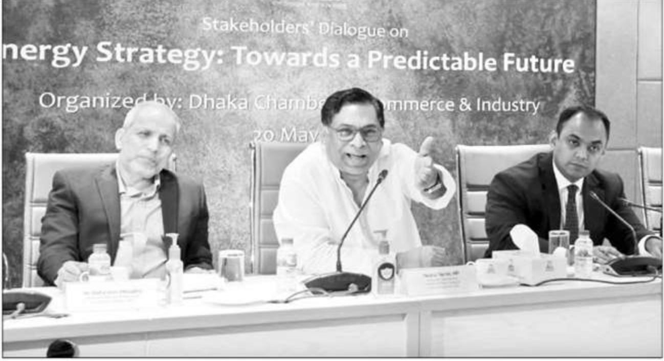
শনিবার রাজধানীর ঢাকা চেম্বার অব কমার্স অ্যান্ড ইন্ডাস্ট্রি আয়োজিত সেমিনারে বক্তব্য রাখেন বিদ্যুৎ, জ্বালানি ও খনিজসম্পদ প্রতিমন্ত্রী নসরুল হামিদ