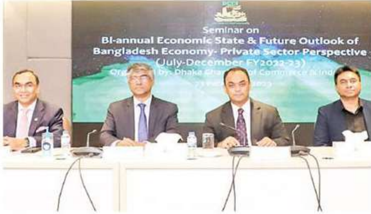
ডিসিসিআই আয়োজিত সেমিনারে বক্তারা