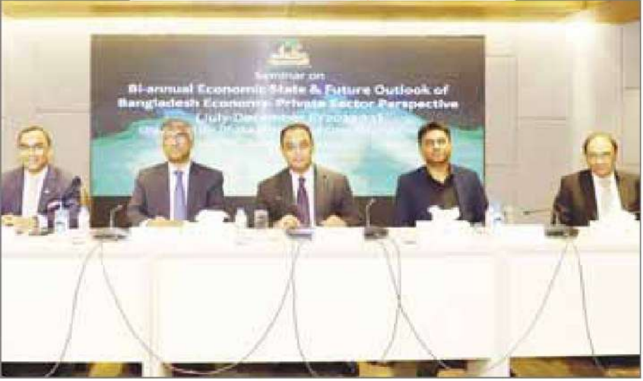
বেসরকারি খাতের দৃষ্টিতে ২০২২-২৩ অর্থবছরের প্রথমার্ধে বাংলাদেশের অর্থনীতির সামগ্রিক পর্যালোচনা শীর্ষক সেমিনারে বক্তারা