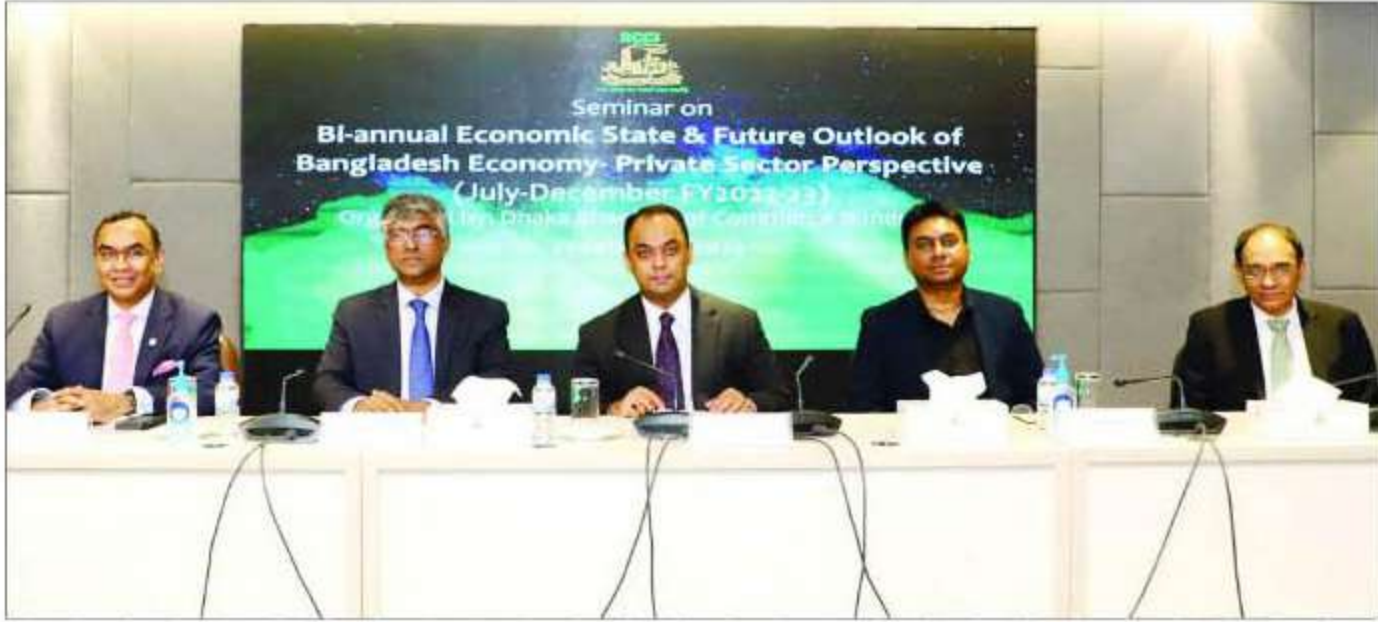
গতকাল ডিসিসিআই আয়োজিত 'বেসরকারি খাতের দৃষ্টিতে ২০২২-২৩ অর্থবছরের প্রথমার্ধে বাংলাদেশের অর্থনীতির সামগ্রিক পর্যালোচনা' শীর্ষক সেমিনারে উপস্থিত অতিথিরা

সুতরাং ব্যবসায়ীদের এখন থেকে প্রস্তুতি নেয়া দরকার। তার নিজস্ব