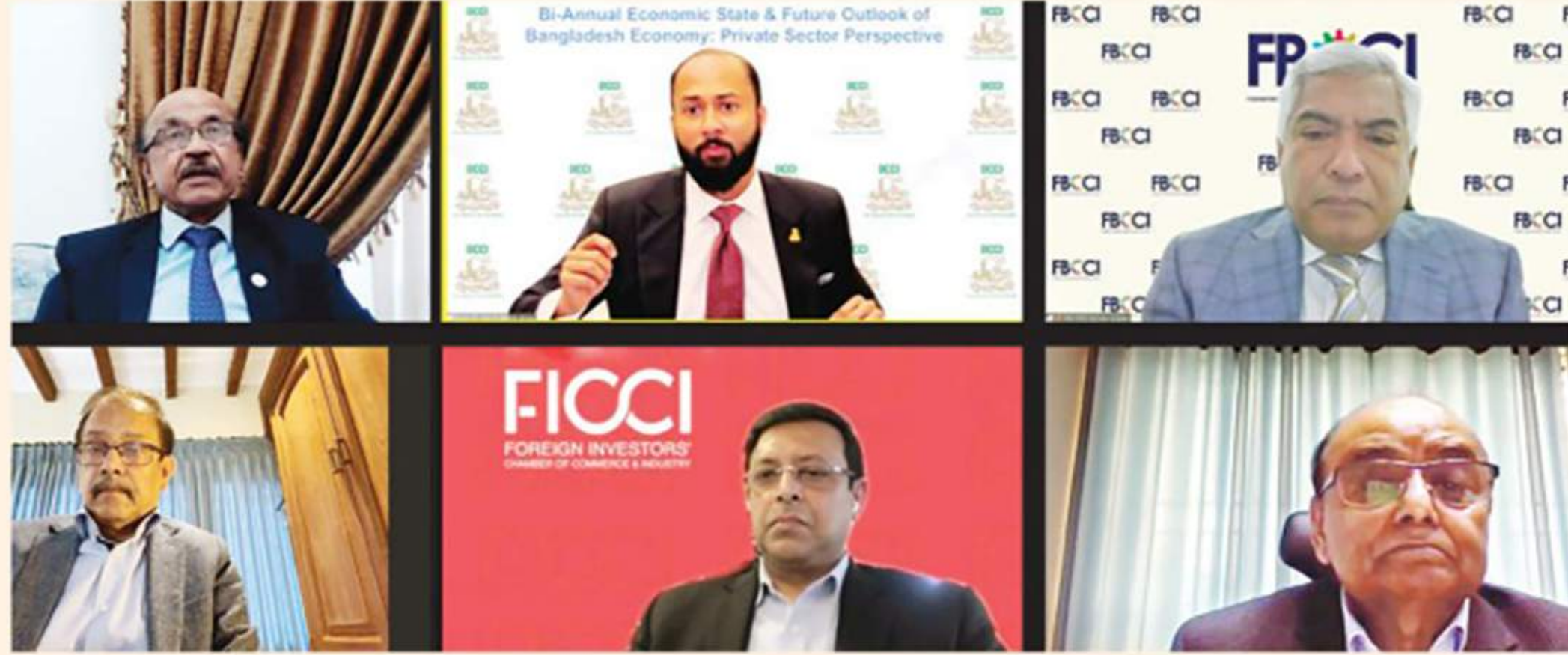
Speakers address a webinar organised by the DCCI on Saturday

"Prices of the essential commodities have increased in the kitchen markets