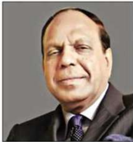
Late Anwar Hossain

Speaking on the occasion, former commerce minister Tofail Ahmed said Anwar Hossain was a man of liberal