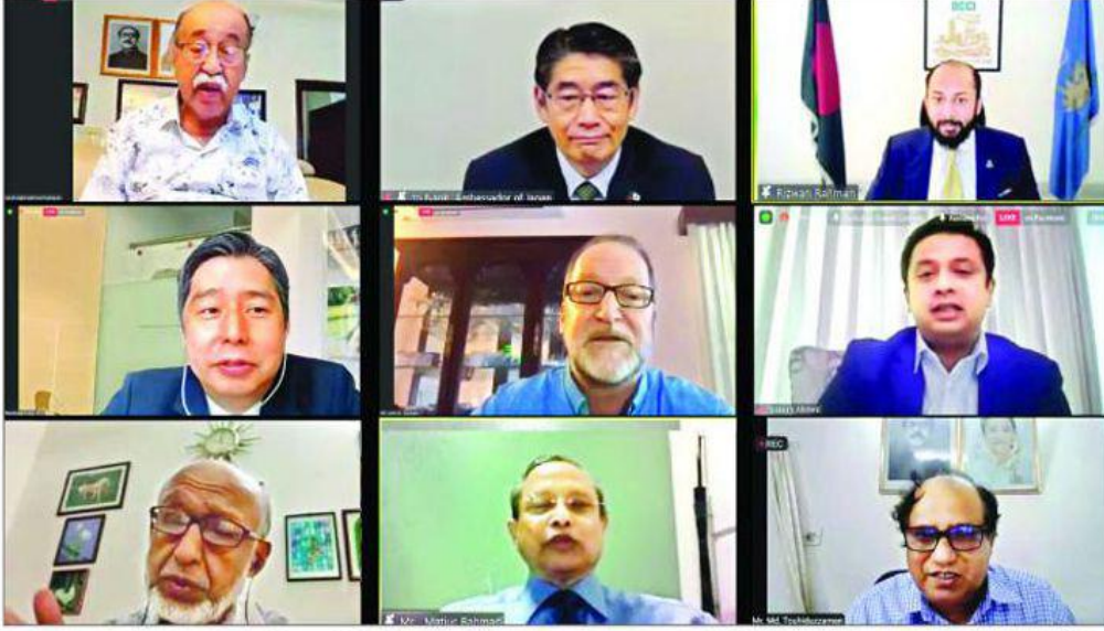
রোববার ঢাকা চেম্বারের ওয়েবিনারে শিল্পমন্ত্রী নূরুল মজিদ মাহমুদ হুমায়ুনসহ অতিথিরা