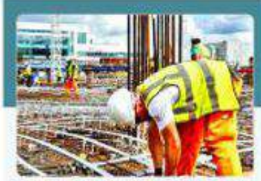
ডিসিসিআইর ওয়েবিনারে বক্তারা

ডিসিসিআই সভাপতি বলেন, অক্সফোর্ড বিশ্ববিদ্যালয়ে শুধু শিক্ষাদান হয় না, সেখানে গবেষণা হয়। সময়ের চাহিদার বিষয়টি গুরুত্ব দেওয়ায় করোনাভাইরাস মোকাবিলায় সব দেশের জন্য সহজলভ্য টিকা তরাই প্রথম উদ্ভাবন করেছে। সময়ের চাহিদাভিত্তিক শিক্ষা ও গবেষণায় বাংলাদেশ অনেক পিছিয়ে। ফলে কাজক্ষিত মাত্রায় বিনিয়োগ আকর্ষণ ও বৈশ্বিক প্রতিযোগিতায় বাংলাদেশ পিছিয়ে পড়ছে। শিক্ষা খাতের গবেষণা কার্যক্রমের জন্য শিল্প খাতের আর্থিক সহায়তাকে কর অব্যাহতি প্রদানের জন্য সরকারের প্রতি আহ্বান জানান তিনি।