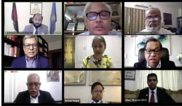
Speakers discuss gaps between education and skills at a webinar on "Industry and Academia Linkage: Role of Academia," organized by the DCCI on April 24, 2021.

Speakers at a webinar urged for tax exemptions on investment in academic research and development