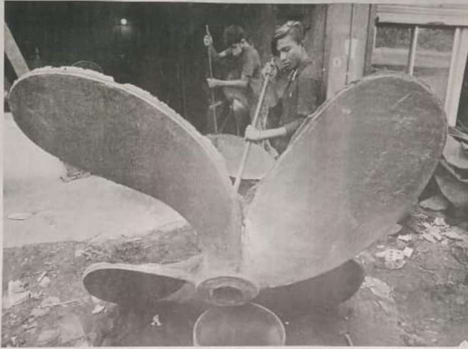
The economy is progressing in the right direction despite many Covid-led challenges, says the DCCI

Skill development, industry-academia collaboration, investment increase in education and research and development and technical and vocational education enhancement were must for job market revive, Rahman