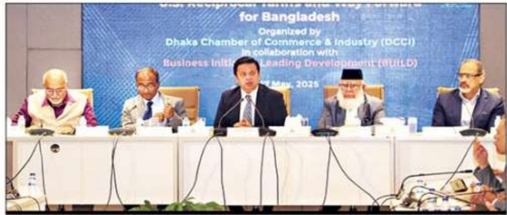
Dhaka Chamber of Commerce and Industry and Business Initiatives Leading Development jointly organises a seminar on 'US Reciprocal Tariffs and the Way Forward for Bangladesh' at the DCCI auditorium on Saturday.

This move threatens Bangladesh's largest export market and progress in labour and sustainability standards.