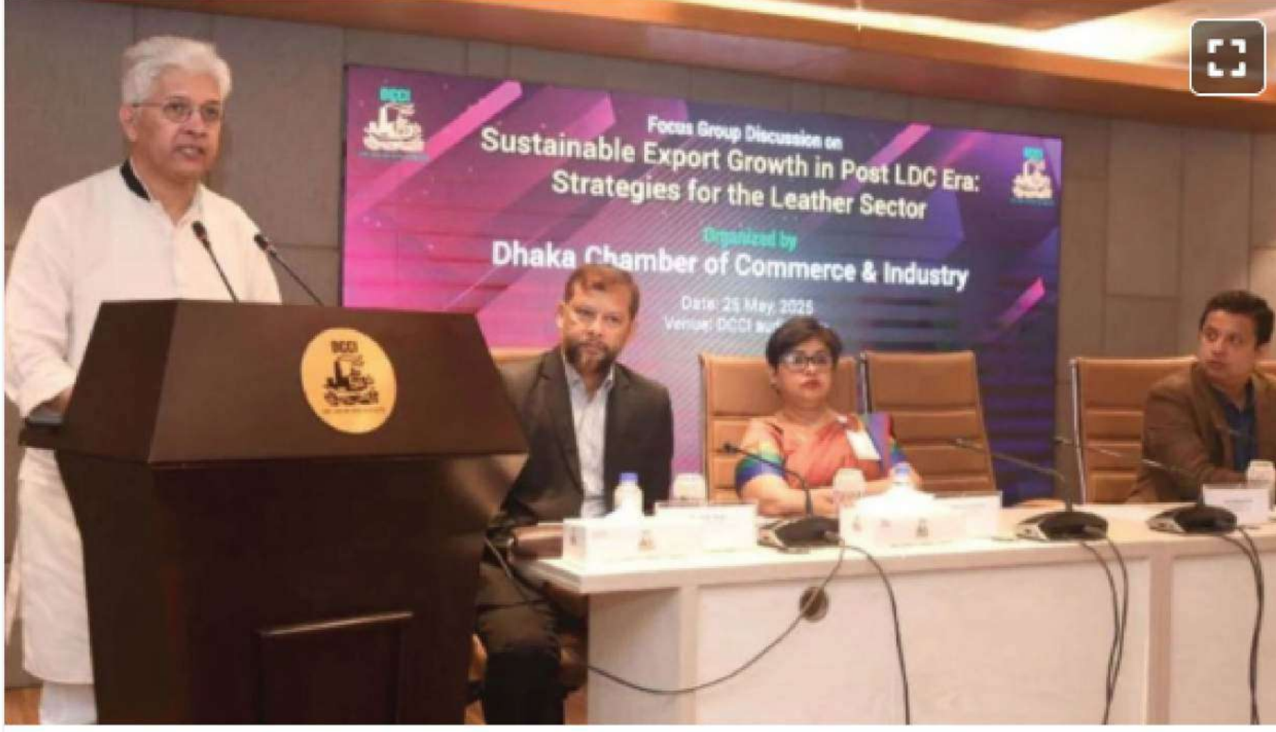
শিল্প উপদেষ্টা আদিলুর রহমান খান রোববার ডিসিসিআই উদ্যোগে আয়োজিত 'চামড়া শিল্পের কৌশল নির্ধারণ, এলডিসি পরবর্তী টেকসই রপ্তানি' শীর্ষক সেমিনারে বক্তব্য দেন।

শিল্প উপদেষ্টা আদিলুর রহমান খান বলেছেন, চামড়া শিল্প খাতে দক্ষতা উন্নয়নের জন্য ট্যানারি এস্টেটে প্রশিক্ষণ ও ডিজাইন সেন্টার প্রতিষ্ঠার উদ্যোগ গ্রহণ করা হয়েছে। তিনি বলেন, চামড়া শিল্পের উন্নয়নে সরকার সমন্বিতভাবে চামড়া শিল্পের পরিবেশগত অবকাঠামো উন্নয়ন, সনদ প্রাপ্তির সক্ষমতা বৃদ্ধি এবং প্রযুক্তিগত সহায়তা প্রদানে কাজ করে যাচ্ছে।