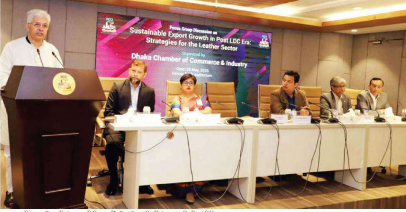
‘চামড়া শিল্পের কৌশল নির্ধারণ: এলডিসি পরবর্তী টেকসই রপ্তানি’ শীর্ষক সভা

পোশাকখাতের মতো আর্থিক প্রগোদনা ও নীতি সহায়তা পেলে ২০৩০ সালের মধ্যে চামড়া শিল্প থেকে বার্ষিক ৫ বিলিয়ন ডলারের রপ্তানি সম্ভব বলে জানিয়েছেন বিশিষ্টজনেরা। ২০৩৫ সালের মধ্যে রপ্তানির পরিমাণ ১০ বিলিয়নেও উন্নীত হতে পারে বলে জানান তারা।