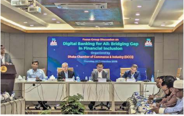
রাজধানীর মতিঝিলে গতকাল ডিজিটাল ব্যাংকিং সম্পর্কিত এক আলোচনা সভায় অতিথিরা

শুক্রবার, ২৬ সেপ্টেম্বর ২০২৫ সমৃদ্ধির সহযাত্রী