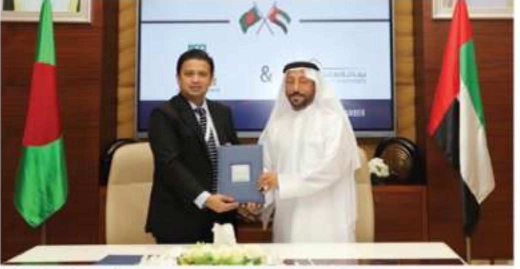
দ্বিপাক্ষিক বিনিয়োগ বৃদ্ধির লক্ষ্যে ঢাকা চেম্বার ও শারজাহ চেম্বারের মধ্যে চুক্তি সই।

ঢাকা: শারজাহ বাংলাদেশ প্রতিষ্ঠানসমূহের পন্য রফতানি ও বাজার সম্প্রসারণ এবং দ্বিপাক্ষিক বিনিয়োগ বৃদ্ধির লক্ষ্যে শারজাহ চেম্বার অব কমার্স অ্যান্ড ইন্ডাস্ট্রি এবং ঢাকা চেম্বার অব কমার্স অ্যান্ড ইন্ডাস্ট্রি (ডিসিসিআই) মধ্যে সমঝোতা স্মারক সই হয়েছে।