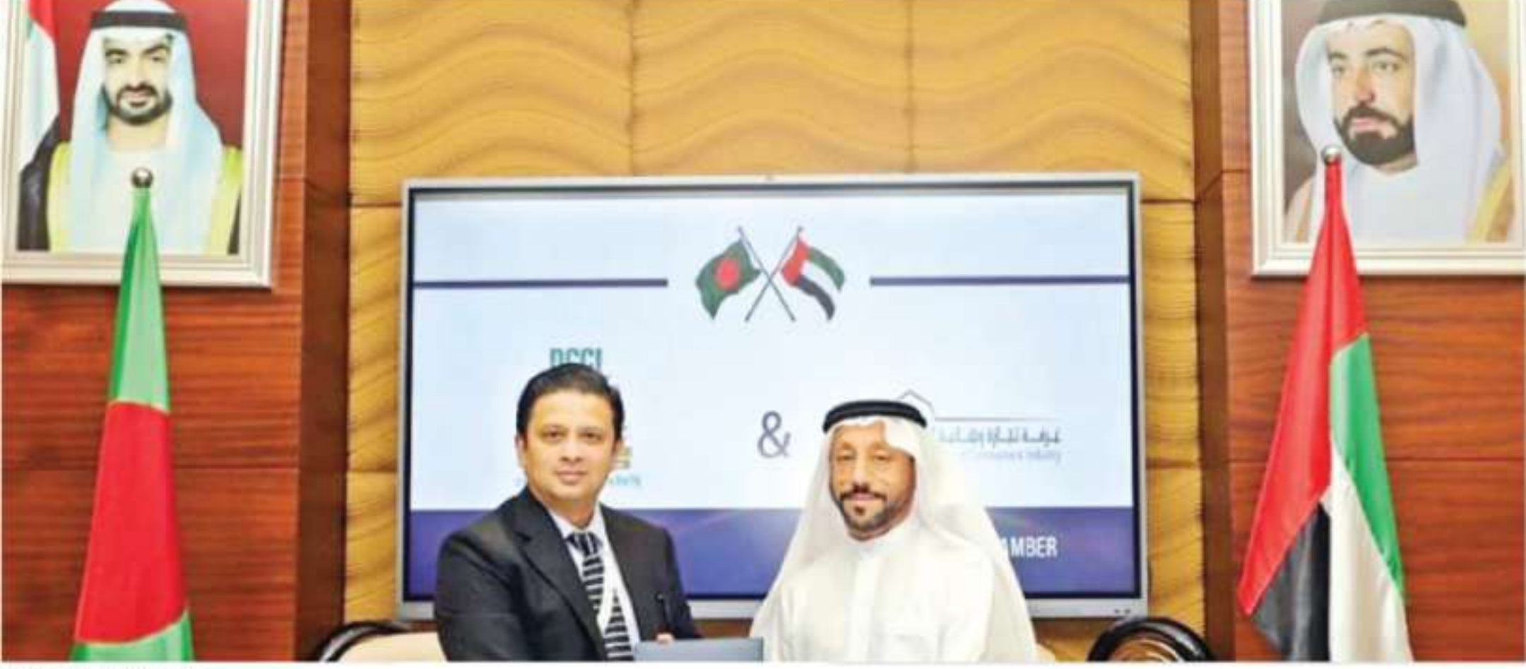
শারজার বিনিয়োগ চায় ঢাকা

প্রকাশ : ২৮ ফেব্রুয়ারি ২০২৫, ০৫:২২ এএম আপডেট : ২৮ ফেব্রুয়ারি ২০২৫, ০৫:২২ এএম