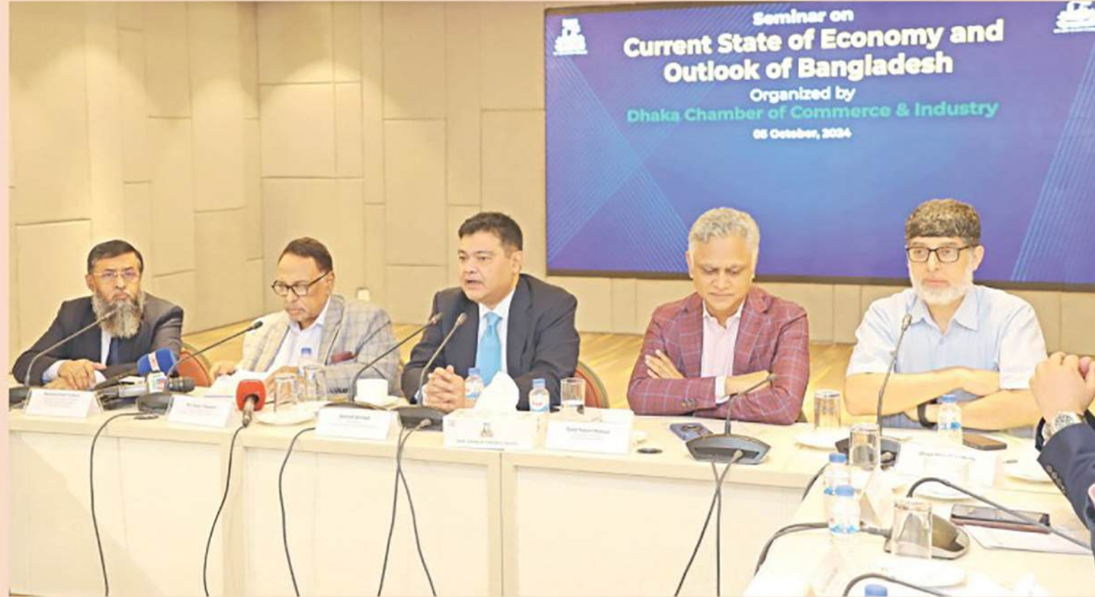
Business leaders discuss the current state of the economy of Bangladesh at a seminar at the DCCI auditorium in Dhaka on Saturday

He also emphasised the need to diversify the energy mix, establish new energy supply routes, and increase investment in the energy sector, which