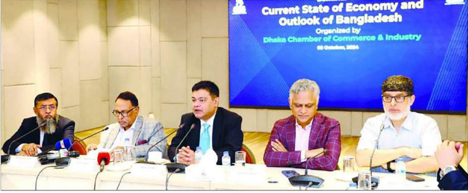
গতকাল ঢাকা চেম্বার অব কমার্স অ্যান্ড ইন্ডাস্ট্রি (ডিসিসিআই) আয়োজিত 'বাংলাদেশের অর্থনীতির বর্তমান অবস্থা পর্যালোচনা এবং ভবিষ্যৎ পথ নির্দেশনা শীর্ষক' গোলটেবিল আলোচনা সভায় উপস্থিত বিভিন্ন খাতের ব্যবসায়ীরা