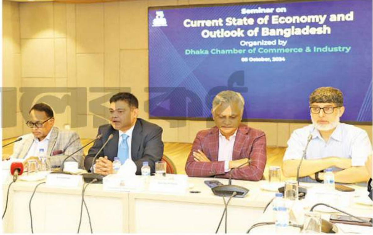
মতিঝিলে নিজস্ব কার্যালয়ে গতকাল ঢাকা চেম্বার অব কমার্স অ্যান্ড ইন্ডাস্ট্রি আয়োজিত সেমিনারে

ঢাকা চেম্বার অব কমার্স অ্যান্ড ইন্ডাস্ট্রি (ডিসিসিআই) আয়োজিত ‘বাংলাদেশের অর্থনীতির বর্তমান অবস্থা পর্যালোচনা এবং ভবিষ্যৎ কর্মপরিকল্পনা নির্ধারণ’ শীর্ষক এক